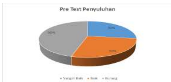
Gambar 2. Diagram Pie Hasil Pre Test Penyuluhan

Pada kegiatan pengabdian masyarakat ini yang meliputi adanya kegiatan penyuluhan dan kegiatan pelatihan tentang Deteksi dan Stimulasi Dini Tumbuh Kembang pada anak, maka didapatkan hasil sebagai berikut :